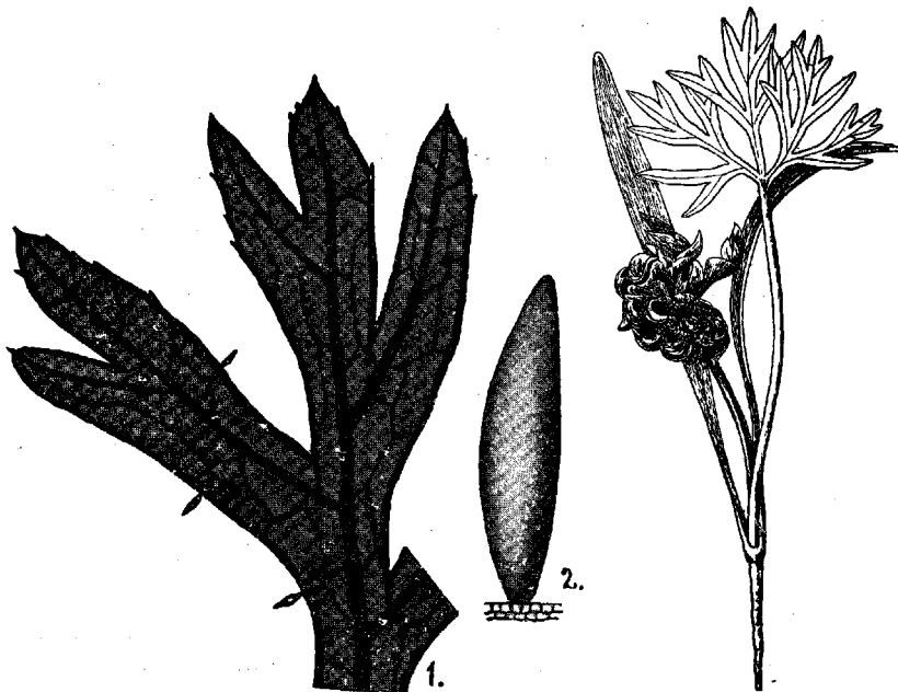
Fig. 2. 1) Gulerods-Bladafsnit med 3 Æg. 20 Gange forstørret. 2) Æg. 120 Gange forstørret.

Larvernes og Nymfernes Sugning af Bladene bevirker, at disse