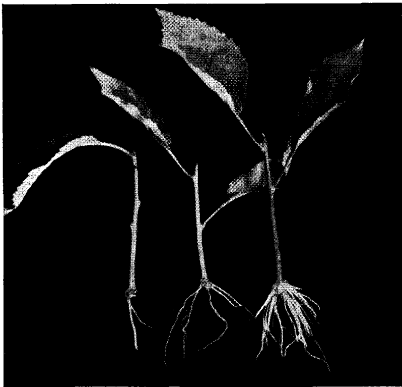
Fig. 2. Urteagtige stiklinger af kirsebærgrundstamme F 12/1 med svag, middelkraftig og meget kraftig rod.

Ved det indledende forsøg viste det sig, at dypning af stiklingernes basis i roddannervæske var en forudsætning for et godt resultat. I forsøgene, som blev stukket midt i september 1959 og midt i juli 1960, benyttedes derfor en plan som anført i tabel 1. Forsøgene viste god overensstemmelse. Væskerne til forsøgsled 2 og 3 er lavet ved opløsning af henholdsvis 500 og 1000 mg indolylsmørsyre (BDH, Horticultural Quality) i ren, koncentreret alkohol og derefter tilsætning af lige dele destilleret vand til i alt 1 liter, hvilket giver 50 pct. alkohol. Væskerne til forsøgsled 4, 5 og