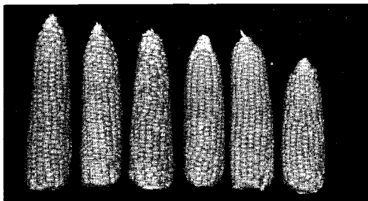
Lbnr. 7 Bravo