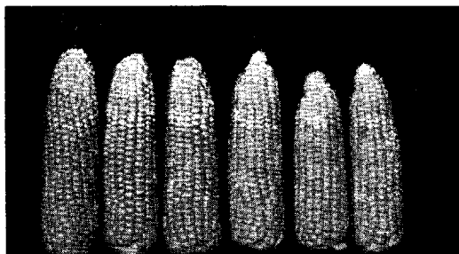
Lbnr. 2 Meny