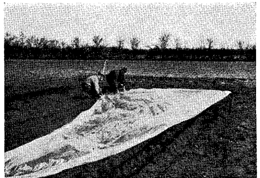
Fig. 1. Plasticfolien lægges på med håndkraft.

(lysstofrør) fra den 17. februar indtil lægning (i 1964 fra 3. marts). Temperaturen i forspiringsrummet var 13-15 °C og luftens relative fugtighed var ca. 90%, i den sidste uge af forspiringstiden dog 80%. Kartoflerne er lagt den 5. eller 6. april i 8 cm dybe riller med 60 cm række- og 30 cm planteafstand. Efter lægning er kartoflerne hyppet svagt, inden plasticfolien er lagt på. Der er anvendt 0,03 mm klar plasticfolie i 4 m brede baner, en bane dækker 6 rækker kartofler. Folien er lagt på med håndkraft og er langs hele kanten dækket med jord, desuden er der lagt enkelte skovfulde jord midt på banen for at holde denne på plads.