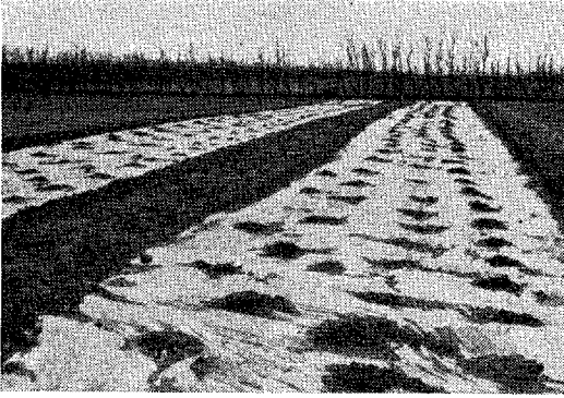
Fig. 2. Plasticfolien er langs hele kanten dækket med jord, desuden er der lagt enkelte skovlfulde jord midt på banen for at holde den på plads.

Prisen på 0,3 mm plasticfolie er med 1966 priser 14,5 øre pr. m 2 – svarende til 1450 kr. pr. ha. I 1968. meddelelse er beskrevet en finsk plasticlæggemaskine til dækning af frilandsgurker, med visse ændringer vil en sådan ma-