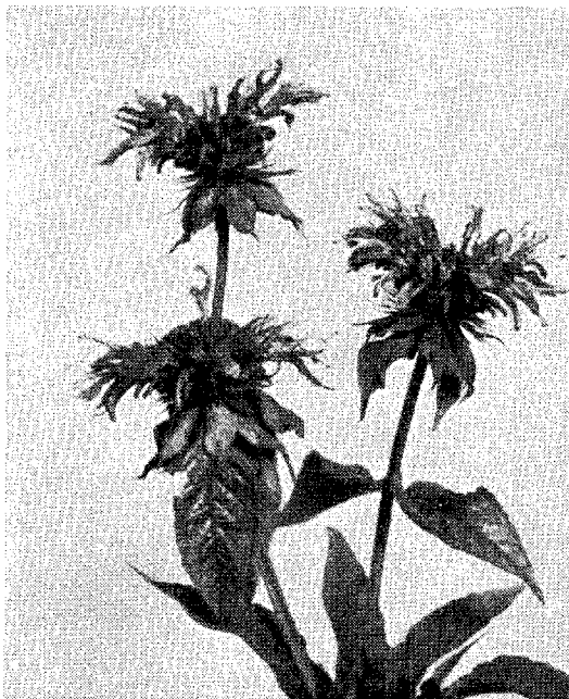
'Adam' S 65. Bemærk den forholdsvis korte afstand mellem etagerne.

Af de 15 afprøvede sorter fandtes 5 at være af så høj dyrkningsværdi, at de anerkendes og får S 65 fjøjet til sortsnavnet. Som det vil bemærkes, er der anerkendt een sort af hver farve. Anerkendelserne er givet på grundlag af daglige iagttagelser i vækstsæsonen, målinger af tilvækst og blomsterstørrelse, vurdering af sundhedstilstand m.v. samt ved 2 årlige bedømmelser af et særligt dommerudvalg, der har givet karakter for voksemåde, vækstkraft, blomsterform og -farve samt handelsværdi. Højst opnåelige pointtal er 10, og 7 point berettiger til anerkendelse. Fællesudvalget for