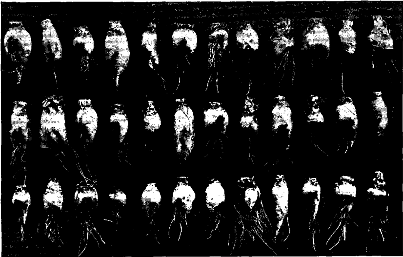
Fig. 2. En degenereret Sludstrup Barres.

viste det sig, at denne Sludstrup Barres gav ca. 20 pCt. Stokløbere og omtrent lige saa mange grenede, 6 pCt. straagule og 6 pCt. rødbedelignende. I Fig. 2 er gengivet 36 Roer, tagne lige for Haanden. Den Roe, der er anbragt midt i Billedet, viser en typisk Sludstrup, og helt fornægter Stammen altsaa ikke sin Oprindelse, men gennemgaaende er Roerne prægede af en Udartning, som berettiger til at frakende Stammen Navnet Sludstrup, men en sludstruplignende Barres kan den til Nød regnes for at være. At Frø af samme Parti ogsaa