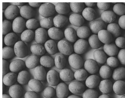
Figure 2. Seeds of soybean coated whit FIX-FERTIG.