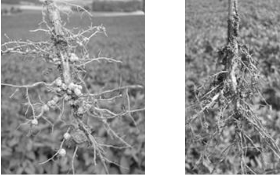
Figure 1. Soybean root with optimal nodulation (left) and without nodules (right).

SAATBAU LINZ provides its pre-inoculation system FIX-FERTIG to all varieties of its portfolio; It results of long research and testing process, to facilitate the work of farmers and secure the very important nodulation process in the field. Through a special production process, the quality Rhizobium HiCoat Super is placed exactly on the seed.