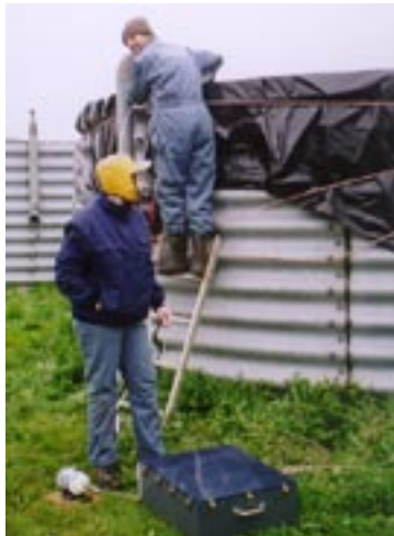
Opsamling af lugtprøver fra gylletank

Lagring og udbringning af gylle fører til betydelige miljøeffekter i form af lugtgener og ammoniakfordampning. Ammoniakfordampningen begrænser værdien af husdyrgødningen og påvirker vandmiljøet og sårbare naturområder, mens lugtgenerne skader landmændenes omdømme både lokalt og nationalt. Tab af ammoniak og lugtstoffer fra gylle sker ved afgivelse af gasser som produceres i gyllen, og størrelsen af tabet afhænger